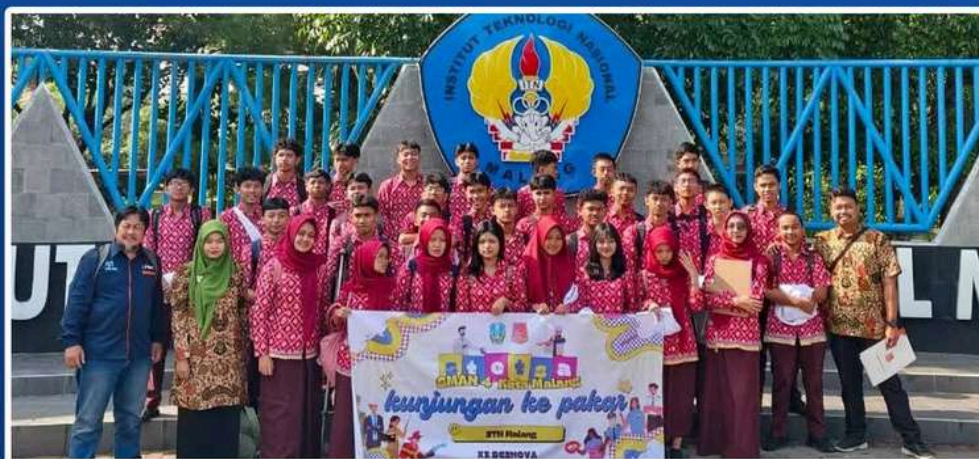
SMAN 4 Kota Malang adakan Kunjungan Pakar Kelas Profesi Karir Impian ke Teknik Kimia ITN Malang.

Rasa penasaran 35 siswa kelas XI Skynova Science dan Teknologi dari SMA Negeri 4 Kota Malang terbayar lunas dalam program “Kunjungan Pakar Kelas Profesi Karir Impian” pada Kamis. Didampingi dua guru, mereka menyerbu Program Studi Teknik Kimia S-1 di Kampus 2 Institut Teknologi Nasional Malang (ITN Malang) untuk belajar potensi inovasi dari hal-hal yang sering dianggap limbah.