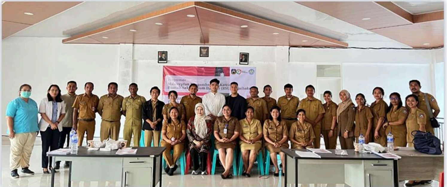
ITN Malang membantu menyiapkan masterplan RSUD Waibakul Sumba Tengah.

Institut Teknologi Nasional Malang (ITN Malang) telah merampungkan penyusunan masterplan Pengembangan Kawasan Rumah Sakit Umum Daerah (RSUD) Waibakul, Kabupaten Sumba Tengah, Provinsi Nusa Tenggara Timur. Laporan akhir dari penyusunan masterplan ini dipresentasikan pada Senin lalu dan mendapat sambutan baik dari pihak RSUD.