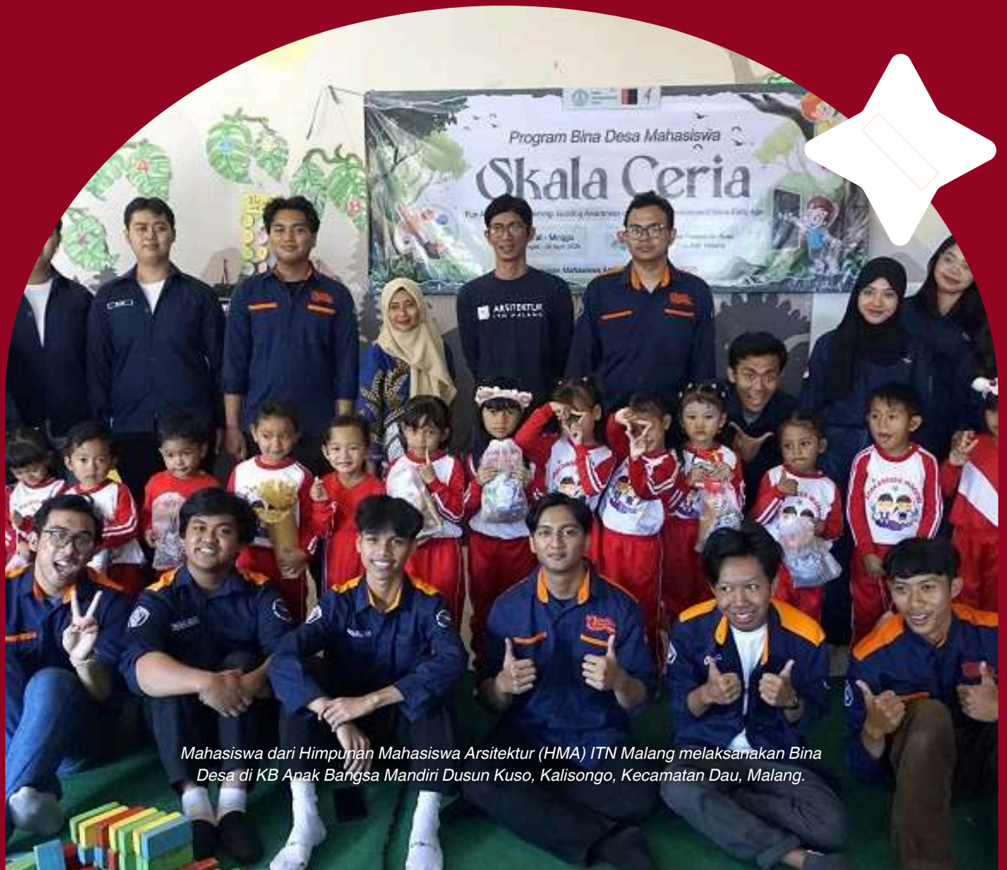
Mahasiswa dari Himpunan Mahasiswa Arsitektur (HMA) ITN Malang melaksanakan Bina Desa di KB Anak Bangsa Mandiri Dusun Kuso, Kalisongo, Kecamatan Dau, Malang.