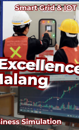
Smart Grid & IOT