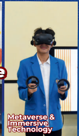
Metaverse & Immersive Technology